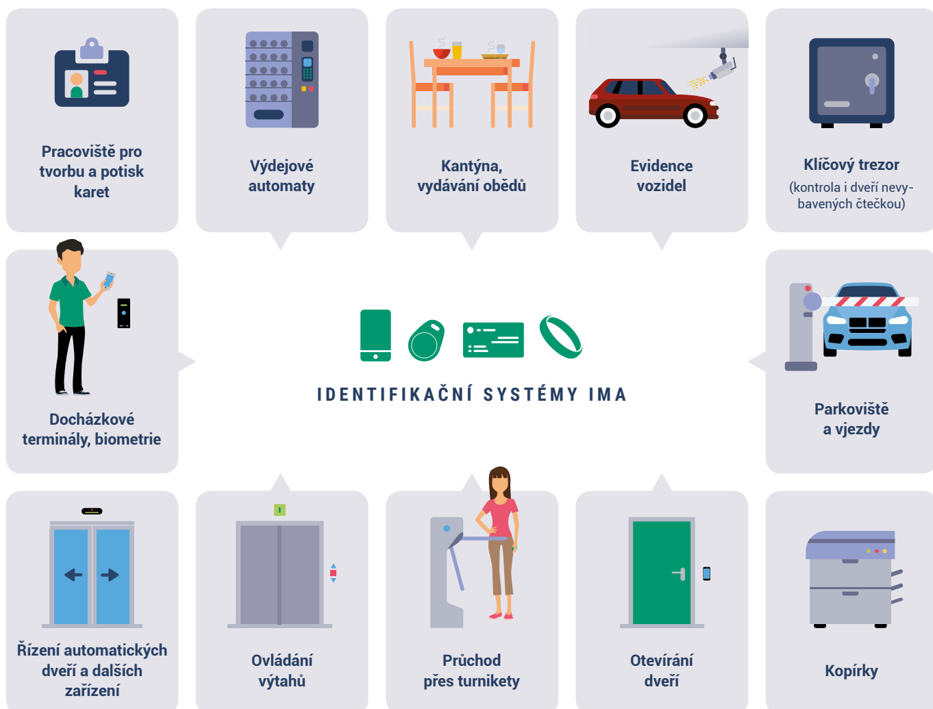
Schéma – uživatelské možnosti použití

Variabilní koncepce systému IMAporter Pro umožňuje jeho aktivní využití v projektech IoT (Internet of Things) s podporou platform Lora, SigFox aj. Uplatnění nachází také v integraci jednotlivých prvků a technologií v projektech SmartHome nebo SmartCities.